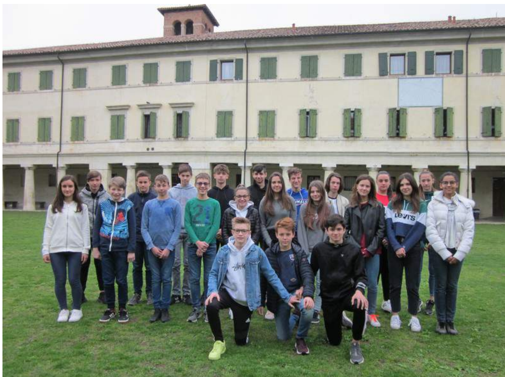
CLASSE III B