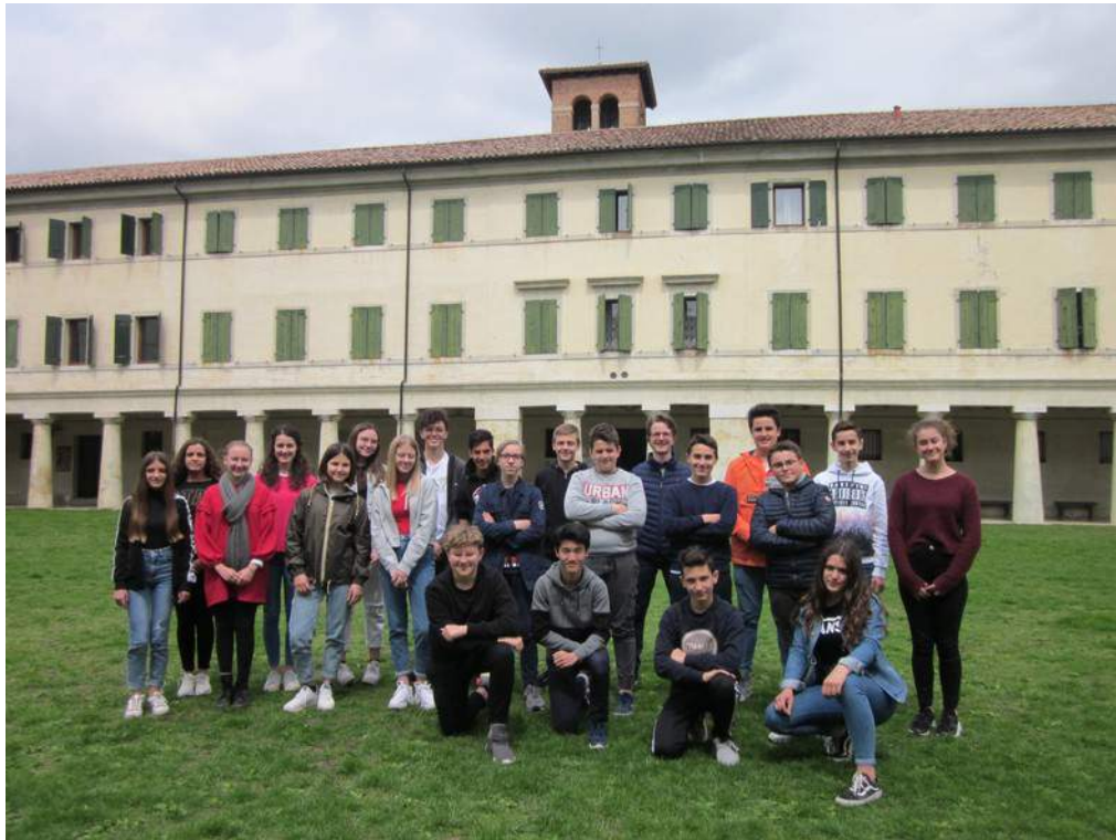
CLASSE III A